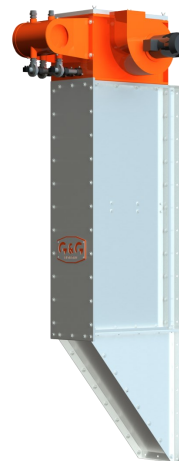
вертикално изпълнение на филтъра