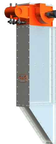
вертикално изпълнение на филтъра